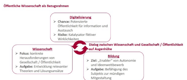
ABBILDUNG 5: ASPEKTE ÖFFENTLICHER WISSENSCHAFT IM KODIA-PROJEKT.

Bezogen auf unseren Forschungsgegenstand einer fortschreitenden Digitalisierung in allen Sphären der Gesellschaft könnte Öffentliche Wissenschaft als Bezugsrahmen in einem Dialog zwischen Wissenschaft und gesellschaftlicher Öffentlichkeit zum Beispiel zu den in der ABBILDUNG 5 benannten Aspekten einsetzen: