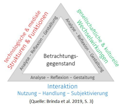
ABBILDUNG 4: FRANKFURT-DREIECK FÜR BILDUNG IN DER DIGITAL VERNETZTEN WELT.

Im „Frankfurt-Dreieck“ erweitert die Gesellschaft für Informatik diesen Ansatz über die schulische Bildung hinaus um die Prozessebene der Analyse, Reflexion und Gestaltung, die in allen drei Perspektiven beachtet werden sollen [17]. Daraus ergibt sich folgendes Modell: