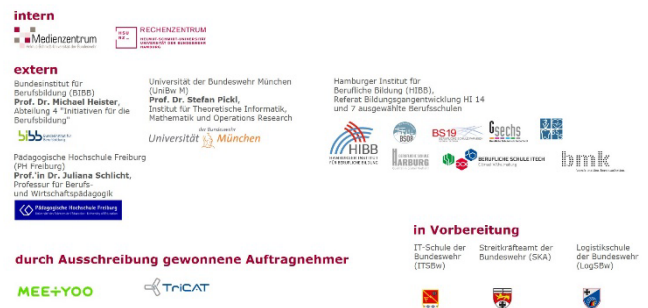
ABBILDUNG 2: KOOPERATIONSPARTNER IM KODIA-PROJEKT.

Kontextualisierte Forschung erfordert eine Einbettung in vielfältige Wirklichkeitsfelder. Deshalb sind in das Projekt KoDiA Kooperationspartner aus ganz unterschiedlichen Bereichen eingebunden: